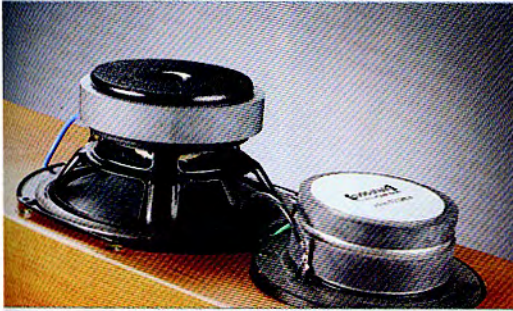
Przy budowie średniotonowca zadbano o dobre ujęcie ciepła z cewki i wkładki magnetycznej